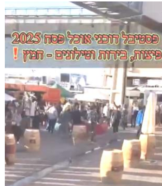
פסטיבל דופי אוכל פסח 2025 פיצות, בירות וטילונים - חמץ!